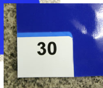
「フィルムめくりタブ」