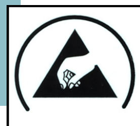
「ESD静電気対策マーク」