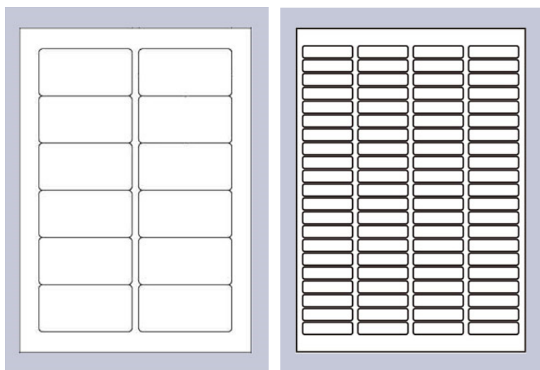
A4に分割線(ハーフカット)を入れた加工例