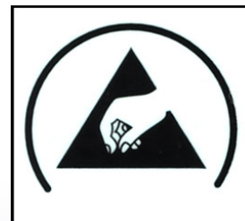
ESDラベルが付属します