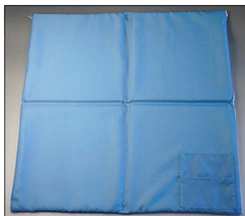
広げて使用します。 (小物が入るポケット付き)